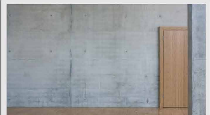
Sichtbeton – Merkblatt und Spiegelbild der Schalhaut