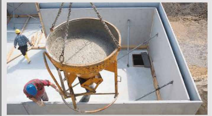
Wasserundurchlässige Bauwerke aus Beton II