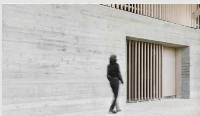
Bauen mit Leichtbeton