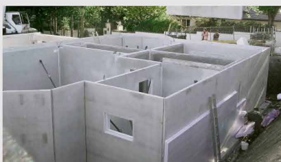
Wasserundurchlässige Bauwerke aus Beton