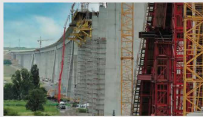
Betontechnik im Brückenbau